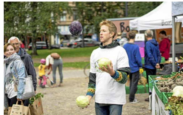
Unik økomarkering: Med prosjektet Økouka hver høst settes det søkelys på økologisk matproduksjon over hele landet. Her fra økomatprofilering på Bondens Marked.