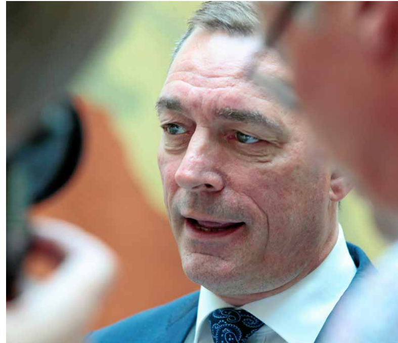
Vil forleng: Utenriksminister Ine Eriksen Søreide og forsvarsminister Frank Bakke-Jensen (bildet) kommenterte økt alliert tilstedeværelse i Norge i vandrehallen på Stortinget i går.